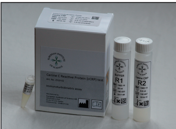
European Institute of Science AB har tillsammans med DiaSystem Scandinavia AB utvecklat veterinära reagens för automatiska analysatorer. På bilden syns reagens för inflammationsmarkören hund-CRP.

Bolaget har även slutit ett joint venture avtal med bolaget Dia-System Scandinavia AB ( www.diasystem.se ) som är verksamt inom produktion och försäljning inom klinisk kemi, hematologi, immunologi samt blodcellsavbildning, med produkter såsom bland annat automatiska analysatorer, reagens, kontroller, IT samt instrument service. Joint venture avtalet omfattar en gemensam produktion samt kommersialisering av reagens, standarder samt kontroller, för detektion av inflammationsmarkörerna CRP hos hund samt SAA hos häst, och som är enbart avsedda för veterinära applikationer på automatiska analysatorer. Produkterna kommer att säljas globalt under EURIS varumärke. Testet för CRP har redan utvecklats internt på EURIS och förväntas att efter en kliniskt evaluering släppas under år 2016 på veterinärmarknaden.