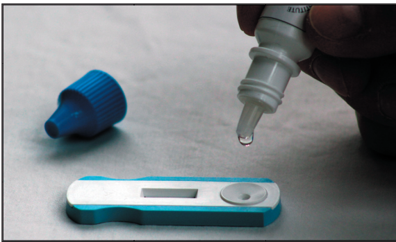
European Institute of Science AB har tillsammans med vår amerikanska joint venture partner utvecklat ett snabbtest för veterinärmarknaden. På bilden syns lateral flow snabbtestet för inflammationsmarkören CRP i hund.

European Institute of Science AB (EURIS) har slutit ett joint venture avtal med ett bolag i USA som är verksamt inom produktion och försäljning av antikroppar och proteinreferenser. Joint venture avtalet omfattar en gemensam utveckling av teknologi samt kommersialisering av lateral flow baserade snabbtest för veterinära marknaden. Avtalet omfattar en global försäljning av snabbtest under EURIS varumärke. Ett snabbtest för hund-CRP planeras bli den första produkten som kommer att kliniskt evalueras samt att lanseras under år 2016 på veterinärmarknaden.