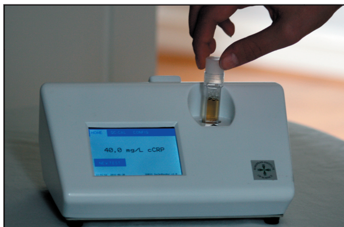
EURIS TurboReader™ veterinärt instrument för patientnära (POC) blodmätning av hund-CRP. Instrumentet erhölet EMC CE-godkännande enligt EN61326-1:2013 och EN61326-2-3:2013 vilket innebär att det uppfyller kraven på elektromagnetisk kompatibilitet (d v s att det inte kan störas av och inte blir störd av annan elektrisk utrustning) och att denna delkomponent i bolagets blodanalyssystem får säljas till kunder inom EU. Med instrumentet kan 15 stycken blodanalyser av bl a hund-CRP (inflammationsmarkör) göras per timme. Vid batteridrift kan instrumentet användas under en hel arbetsdag utan tillgång till nätspänning.

Instrumentet är kompakt för att inte ta upp onödig arbetsyta hos kunderna samt väger ca 1 kg. Det kräver inga extra kalibrerings- eller skötselprocedurer och är redan anpassat för internationellt bruk med en bred spänningsmatning (100-230 V och 50-60 Hz). Instrumentet är CE-märkt och uppfyller således EUs EMC normer. Instrumentet har en datorkommunikationsport (RS232) för utskrift av data (skrivare finns som tillval) samt för tvåvägs dataöverföring (LIS). Vidare är instrumentet anpassat för fältbruk eftersom det även är batteridrivet (5 V).